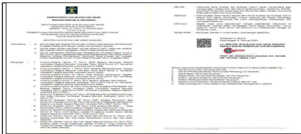
Contoh Surat Keputusan Analisis dan Evaluasi PUU